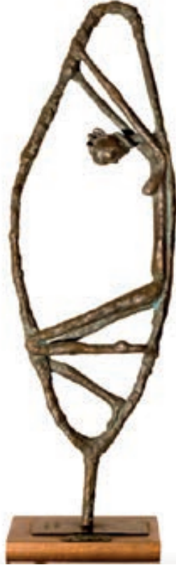
“Mistero” di Mauro Crocetta, 1993, bronzo – fusione a cera persa, cm 70×40

Ha partecipato, su invito, alla XI Biennale Internazionale Dantesca sotto l’alto patrocinio del Presidente della Repubblica – Ravenna 1° aprile /30 settembre 1994 –